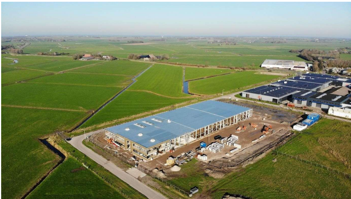
Bovenstaande foto is met een drone genomen en geeft een mooie impressie van de stand van zaken in het werk (eind 2020), maar ook hoe het nieuwe pand is gesitueerd in het landschap.

De effecten van de nieuwbouw zijn in deze begroting verwerkt.